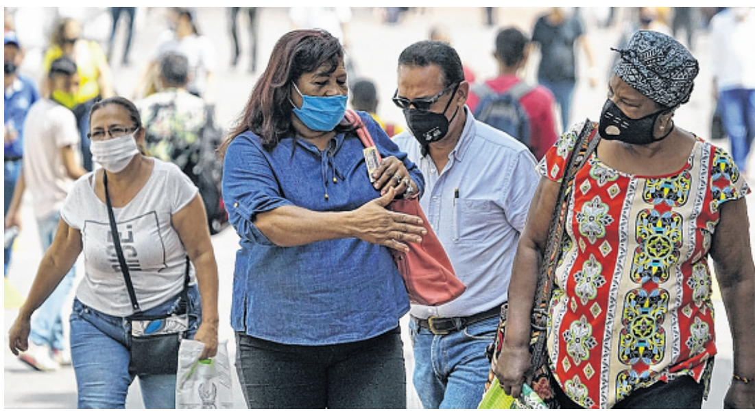
Se continuará reforzando los protocolos de bioseguridad. En febrero de 2021 se deberá hacer análisis de la progresión del covid para determinar si se continúa o no en estado de emergencia.