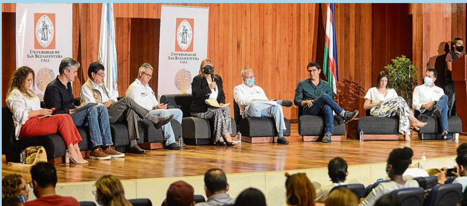
En la Universidad San Buenaventura Cali tuvo lugar ayer el debate 'Diálogos por la Democracia', con ocho candidatos a la Cámara de Representantes por el Valle del Cauca, quienes fueron escuchados de manera presencial por los estudiantes de ese centro académico.

Ocho aspirantes a la Cámara de Representantes debatieron sobre educación e infraestructura. ¿Expulsarían a los ciudadanos venezolanos?